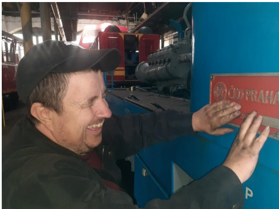
Obrázek č.10 k článku V depu s námi pěkně zatočili