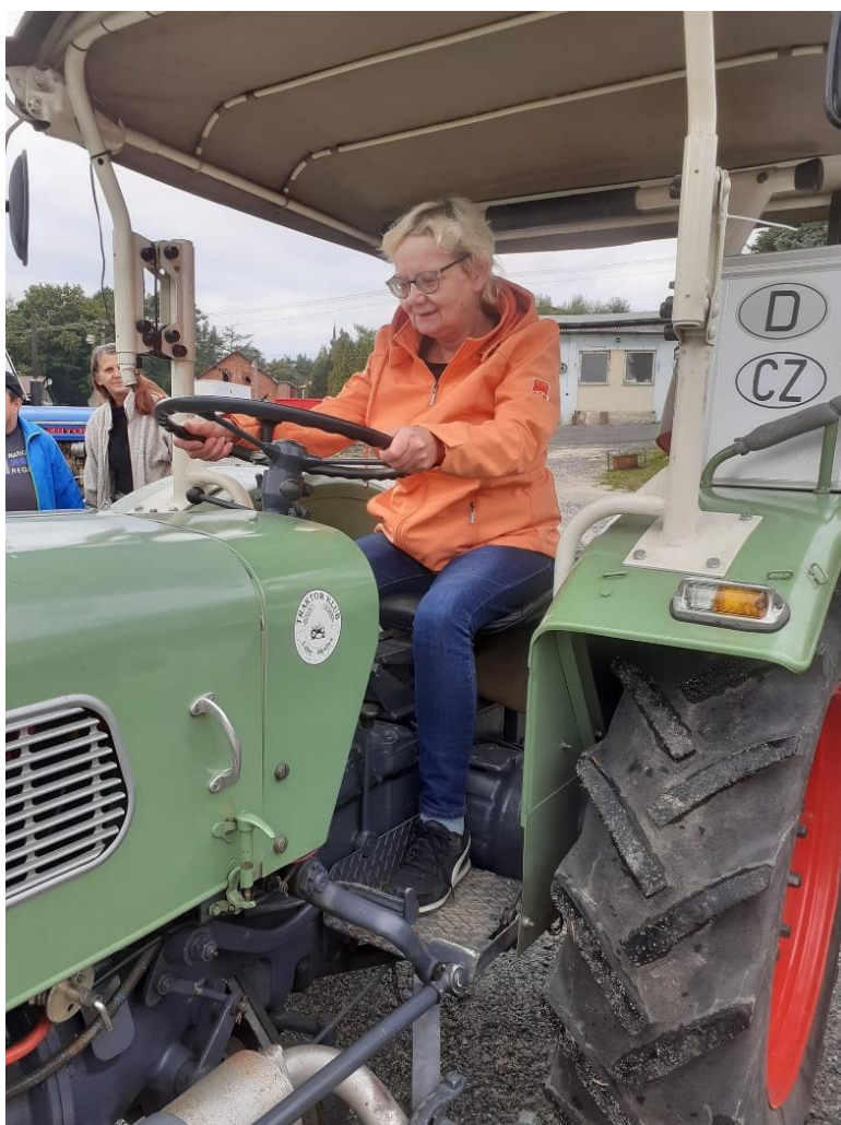
Obrázek č.7 k článku Návštěva muzea traktorů ve Skalně

Klientka chebského střediska na traktoru