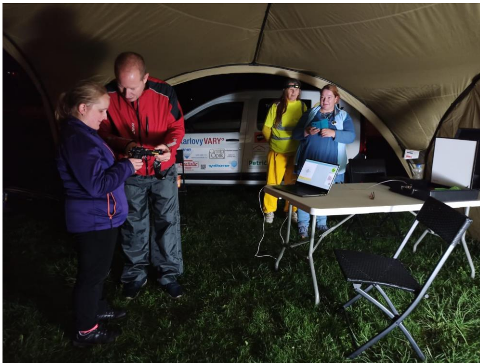
Obrázek č.8 k článku Běh pro světlušku Pracovníci a klienti TyfloCentra