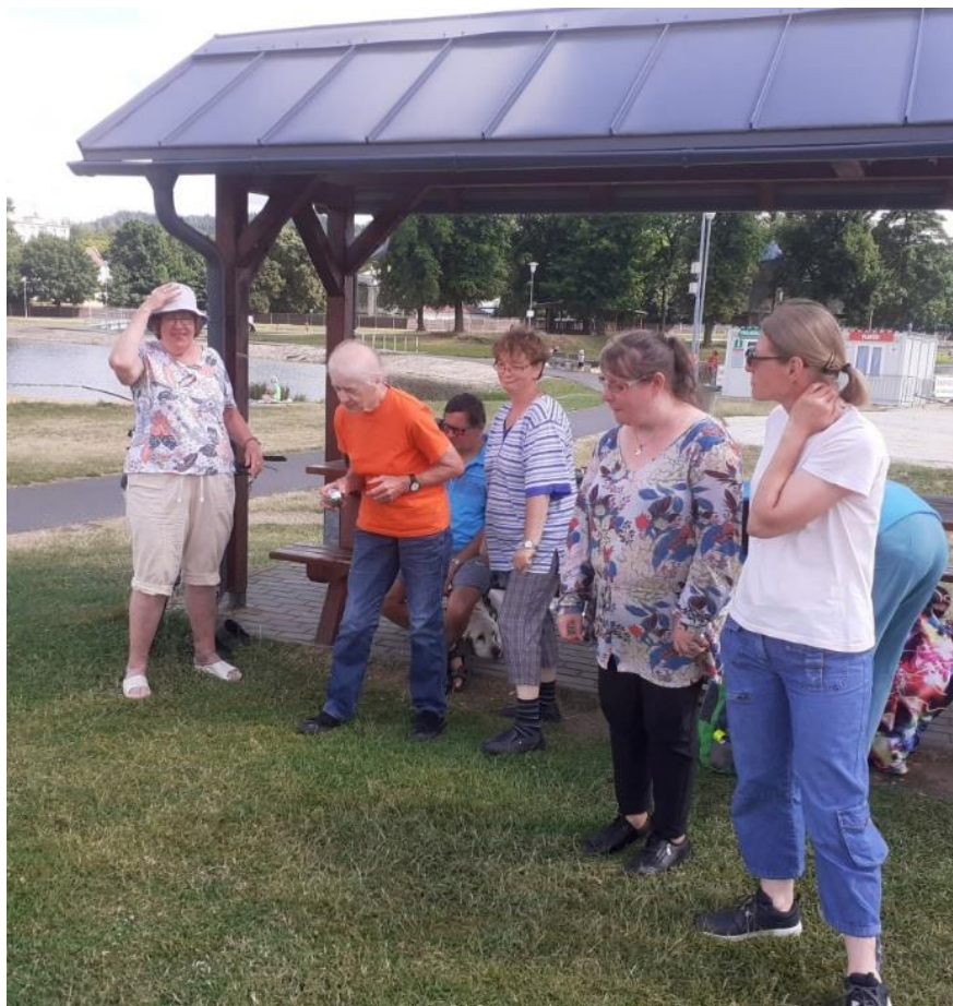
Obrázek č.4 k článku Báječný relax na Rolavě

Klienti TyfloCentra na cestě k rybníku Kolovák