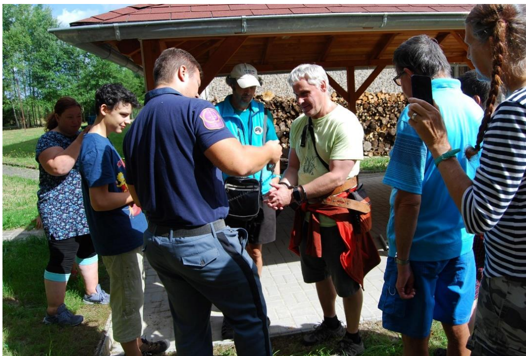
Obrázek č.6 k článku Exkurze do věznice v Kolové

Klienti TyfloCentra s pracovníkem věznice