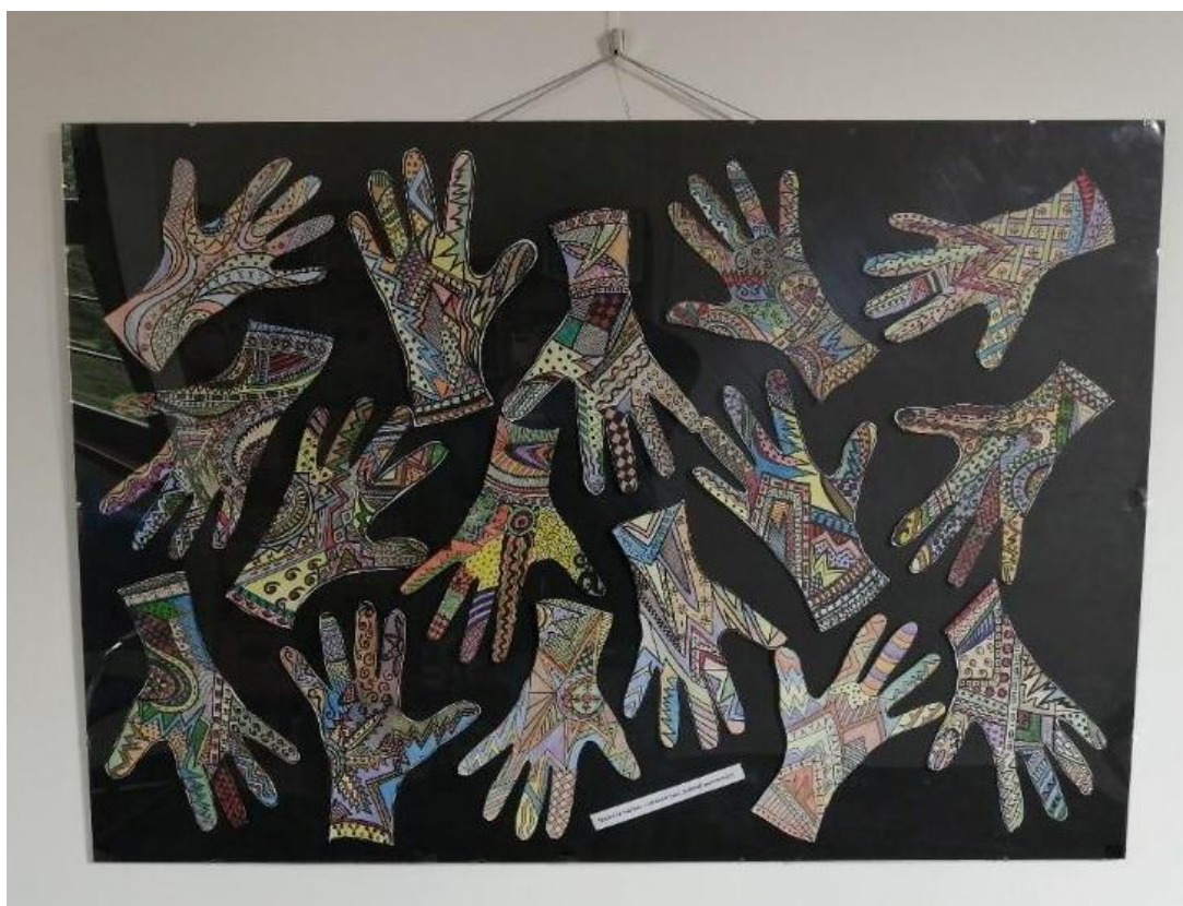
Obrázek č.11 k článku Motivační výstava v MK Ostrov